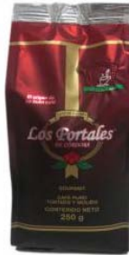
Café Tostado y Molido Regular Marca : Los Portales de Córdoba Presentación : Bolsa aluminizada Gramaje : 250 grs