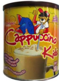
Café Soluble Aglomerado Capuchino Marca : Cappuccino kids Presentación : Lata Gramaje : 360 grs Detalles : Fortificado con vitaminas y minerales. Sin Cafeína