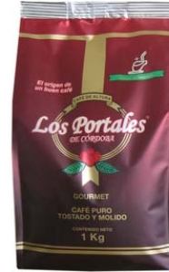
Café Tostado y Molido Regular Marca : Los Portales de Córdoba Presentación : Bolsa Aluminizada Gramaje : 1000 grs