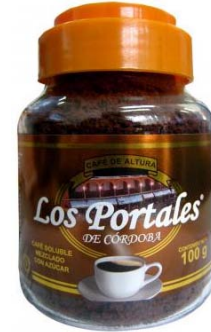
Café Soluble Aglomerado Mezclado Marca : Los Portales de Córdoba Presentación : Frasco de Cristal Gramaje : 100 grs