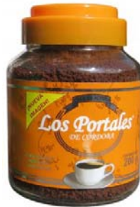
Café Soluble Aglomerado Mezclado Marca : Los Portales de Córdoba Presentación : Frasco de cristal Gramaje : 200 grs