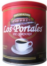
Café Soluble Aglomerado Regular Marca : Los Portales de Córdoba Presentación : Lata Gramaje : 200 grs