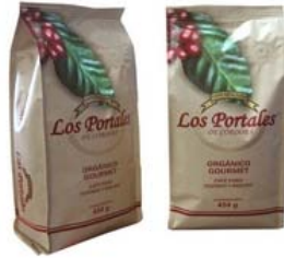
Café Tostado y Molido Orgánico Marca : Los Portales de Córdoba Presentación : Bolsa Aluminizada Gramaje : 454 grs