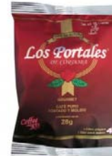
Tostado y Molido Regular Marca : Los Portales de Córdoba Presentación : Kil Hotelero Gramaje : 28 grs Detalles : Cada paquete contiene *1 Sobre de papel filtro para cafetera con 28 gramos de café 100% puro tostado y molido *2 Sobres de Azúcar. *2 Sobres de sustituto de azúcar *1 Sobre de crema *1 Agitador