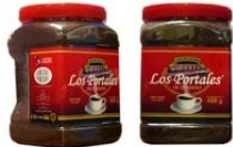
Café Soluble Aglomerado Regular Marca : Los Portales de Córdoba Presentación : Envase de PET Gramaje : 450 grs