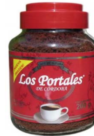
Café Soluble Aglomerado Regular Marca : Los Portales de Córdoba Presentación : Frasco de Cristal Gramaje : 200 grs