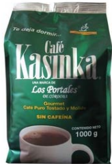
Café Tostado y Molido Sin cafeína Marca : Kasinka Presentación : Bolsa Aluminizada Gramaje : 1000 grs