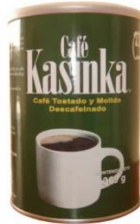
Café Tostado y Molido Sin cafeína Marca : Kasinka Presentación : Lata Gramaje : 369 grs