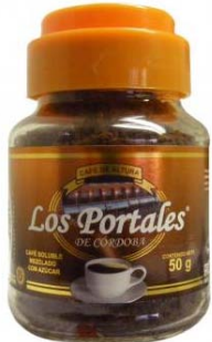
café soluble aglomerado Mezclado Marca : Los Portales de Córdoba Presentación : Frasco de Cristal Gramaje : 50 grs