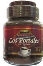
Café Soluble Aglomerado Regular Marca : Los Portales de Córdoba Presentación : Frasco de Cristal Gramaje : 50 grs