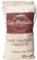
Café Tostado y Molido Regular Marca : Los Portales de Córdoba Presentación : Costal de Yute Gramaje : 500 grs