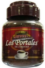
Café Soluble Aglomerado Regular Marca : Los Portales de Córdoba Presentación : Frasco de Cristal Gramaje : 100 grs