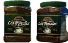
Café Soluble Aglomerado Sin cafeína Marca : Los Portales de Córdoba Presentación : Envase de PET Gramaje : 450 grs