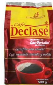
Café Tostado y Molido Mezclado Marca : Declase Presentación : Bolsa Aluminizada Gramaje : 500 grs Detalles : Este producto está compuesto por 70% café y 30% azúcar caramelizada, la cual le da al café un tono más oscuro así como un sabor más fuerte. El tostado y molido es un producto elaborado con café arábica, se caracteriza por tener muy buen cuerpo, marcado amargor y mediana acidez. Presentaciones: Bolsa aluminizada de 500 y 250 grs.